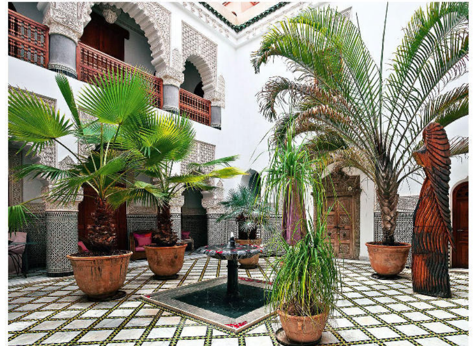
Riad Enija (ca. 1860) Marrakesch